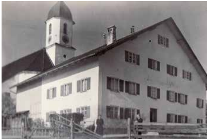
Pfarrhof Zell um 1930