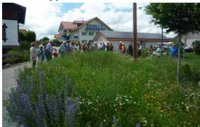
Foto: Artenreiche Blumenwiese bei Hennenschwang - Rundgang durchs Dorf bei Veranstaltung Bayern Tour Natur