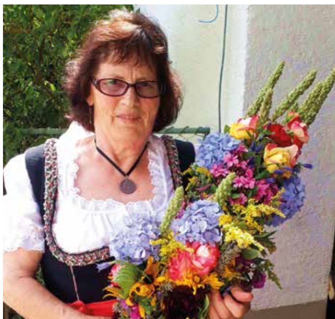
Das Bild zeigt die Jubilarin mit der liebevoll angefertigten Kräuterstange vom 15. August 2019