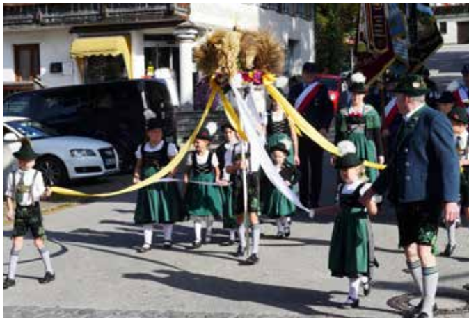
Prozession vom Schloss zur Pfarrkirche St. Martin